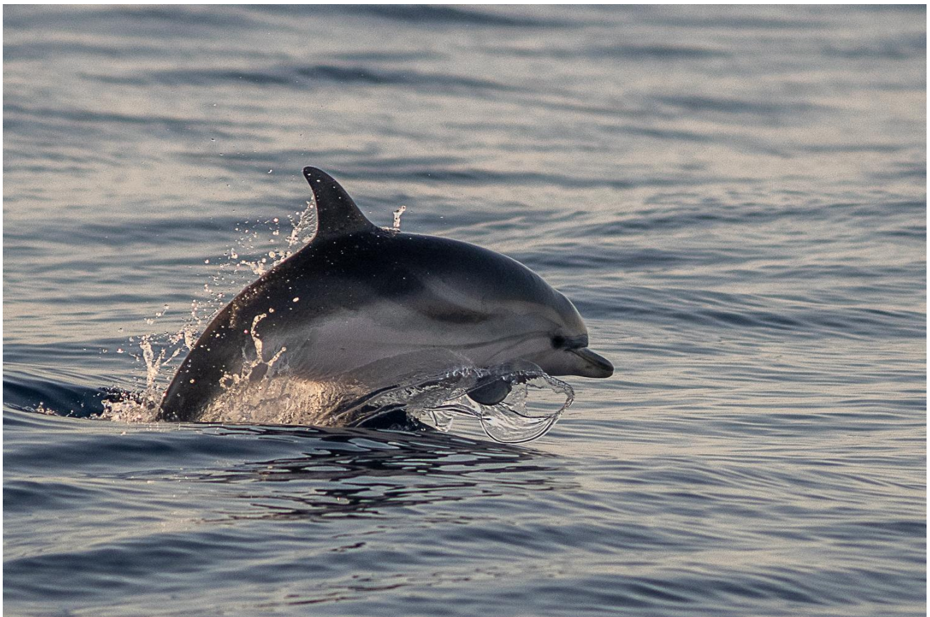
Dauphin bleu et blanc – Stenella coeruleoalba

Repas préparés en communauté et pris à bord.