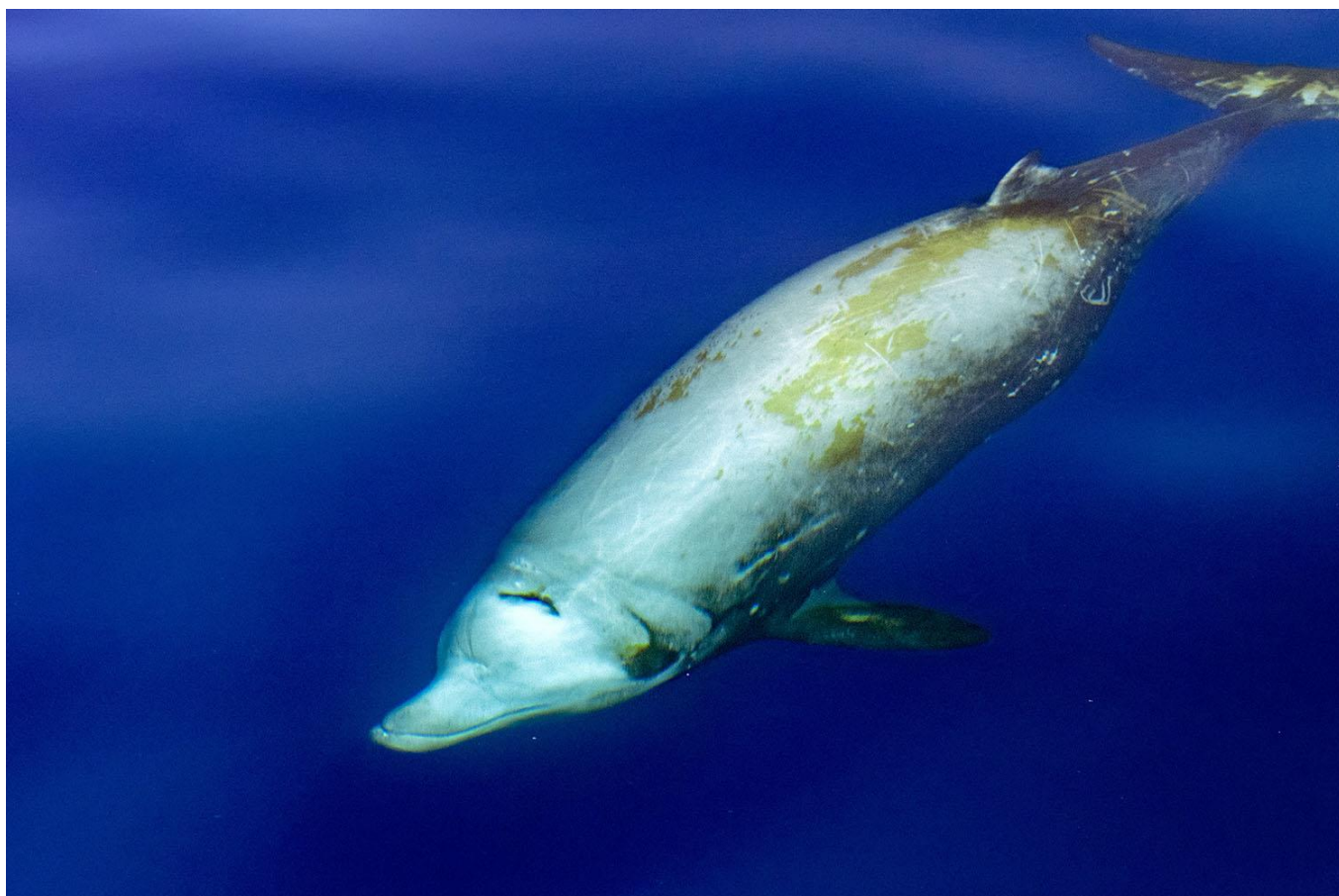
Baleine à bec – Ziphius cavirostris

Rejoignez une croisière unique de 15 jours et 14 nuits et traversez la Méditerranée en Catamaran ! Destination : la Corse et le nord de la Sardaigne depuis Marseille, avec un retour à Propriano. Ce périple scientifique et éco-responsable vous plongera dans l'univers fascinant des cétacés et de la vie marine . Nous traverserons des zones riches en biodiversité, telles que les canyons sous-marins, pour observer globicéphales, cachalots et, avec un peu de chance, les mystérieuses baleines à bec . Vous apprendrez à naviguer de manière éco-responsable tout en collectant des données scientifiques , comme la photo-identification et l'observation comportementale.