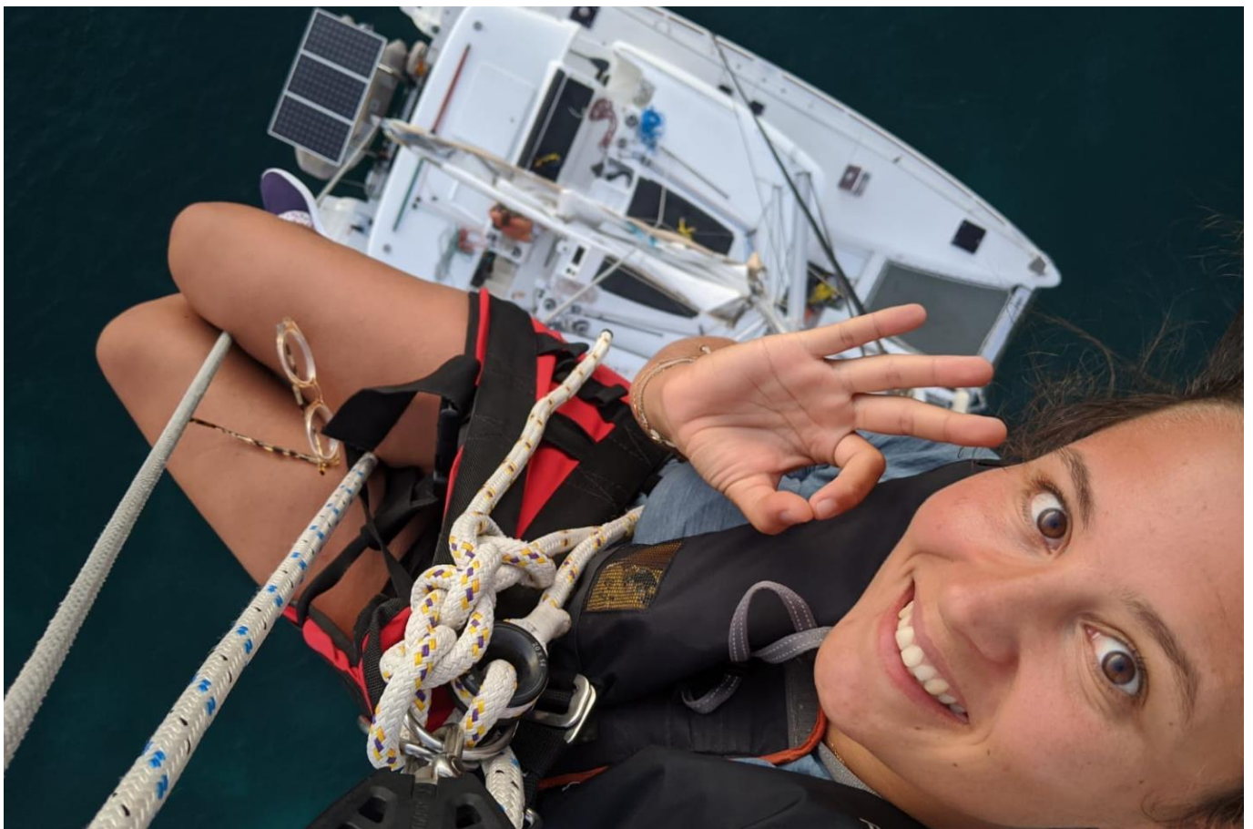
En haut du mât de Lipopette – Catamaran Lagoon 450F

Ce programme est donné à titre indicatif. Les conditions météorologiques et de navigation détermineront in fine les jours de traversée jusqu'à la Corse et la Sardaigne, les mouillages, les nuits en mer, le temps passé sur chaque site.