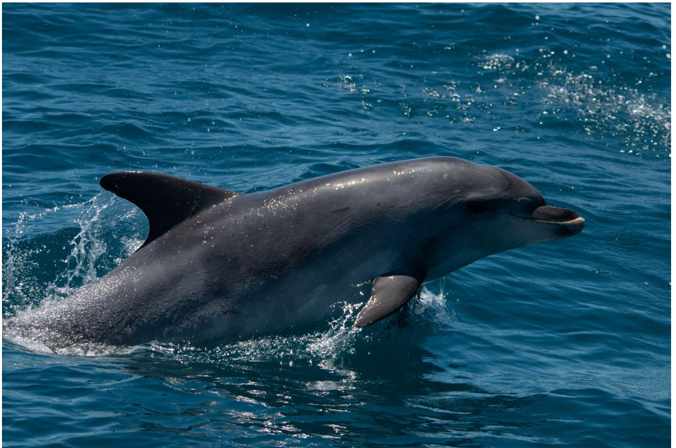
Grand dauphin – Tursiops truncatus

Repas préparés en communauté et pris à bord.