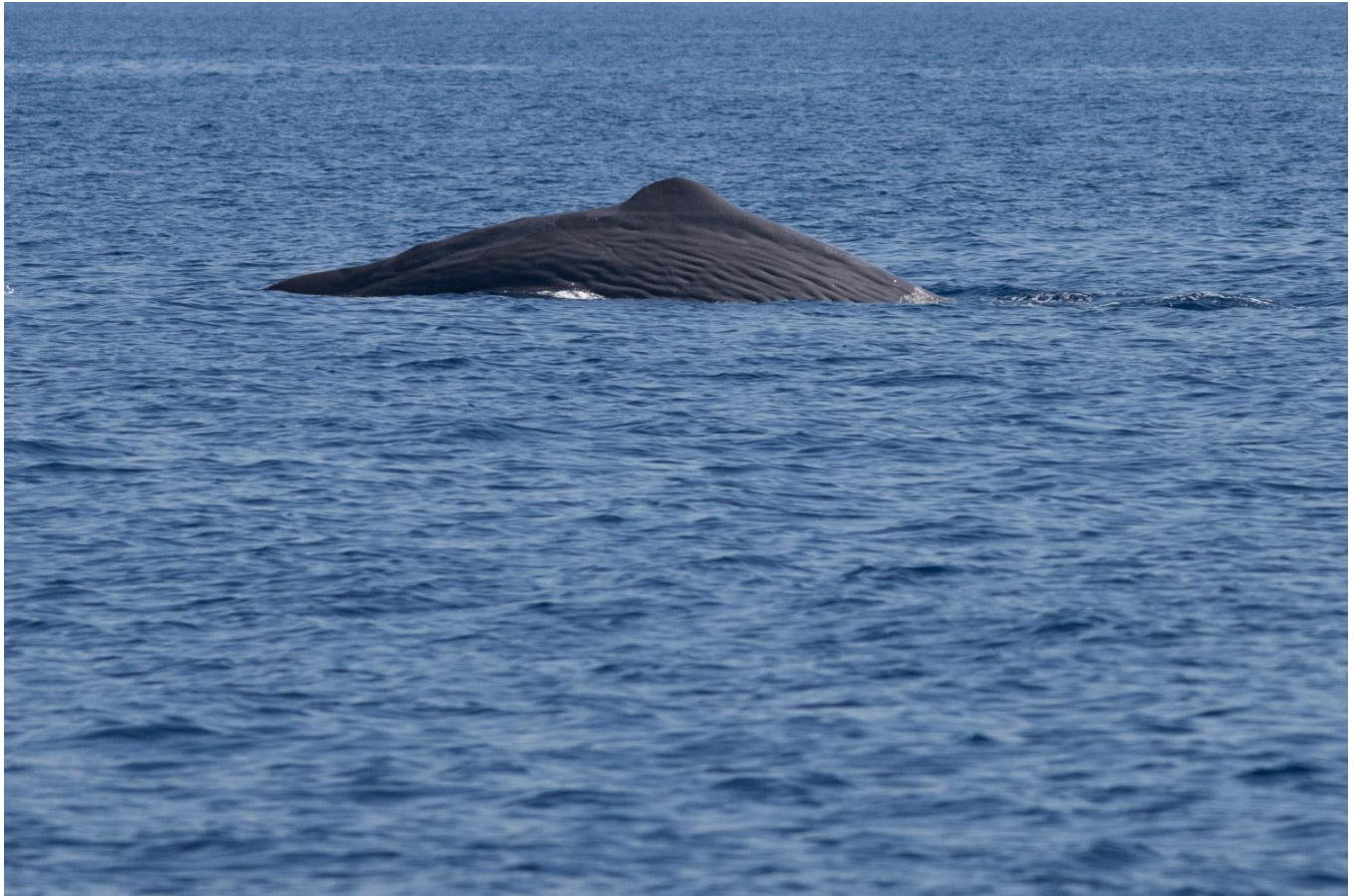
Cachalot – Physeter macrocephalus

Repas préparés en communauté et pris à bord.