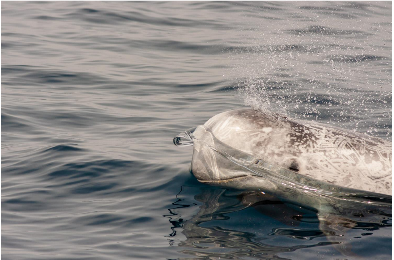
Dauphin de Risso –Grampus griseus

Repas préparés en communauté et pris à bord.