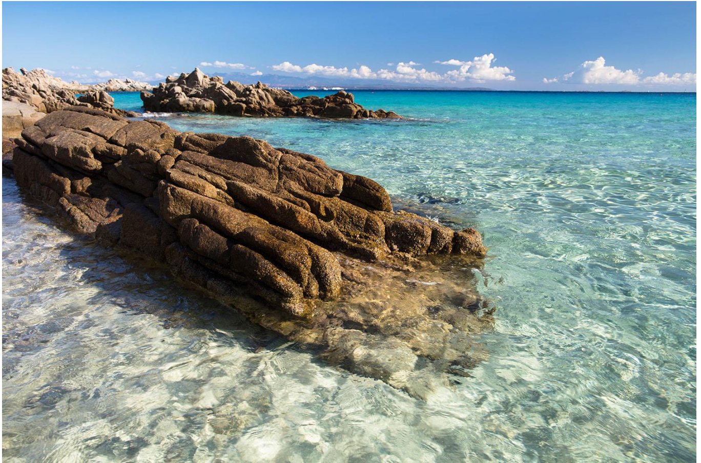
Archipel de la Maddalena

instant est une invitation à l'émerveillement et à la découverte . C'est une occasion unique d'explorer des zones emblématiques de la Méditerranée tout en contribuant activement à leur protection.