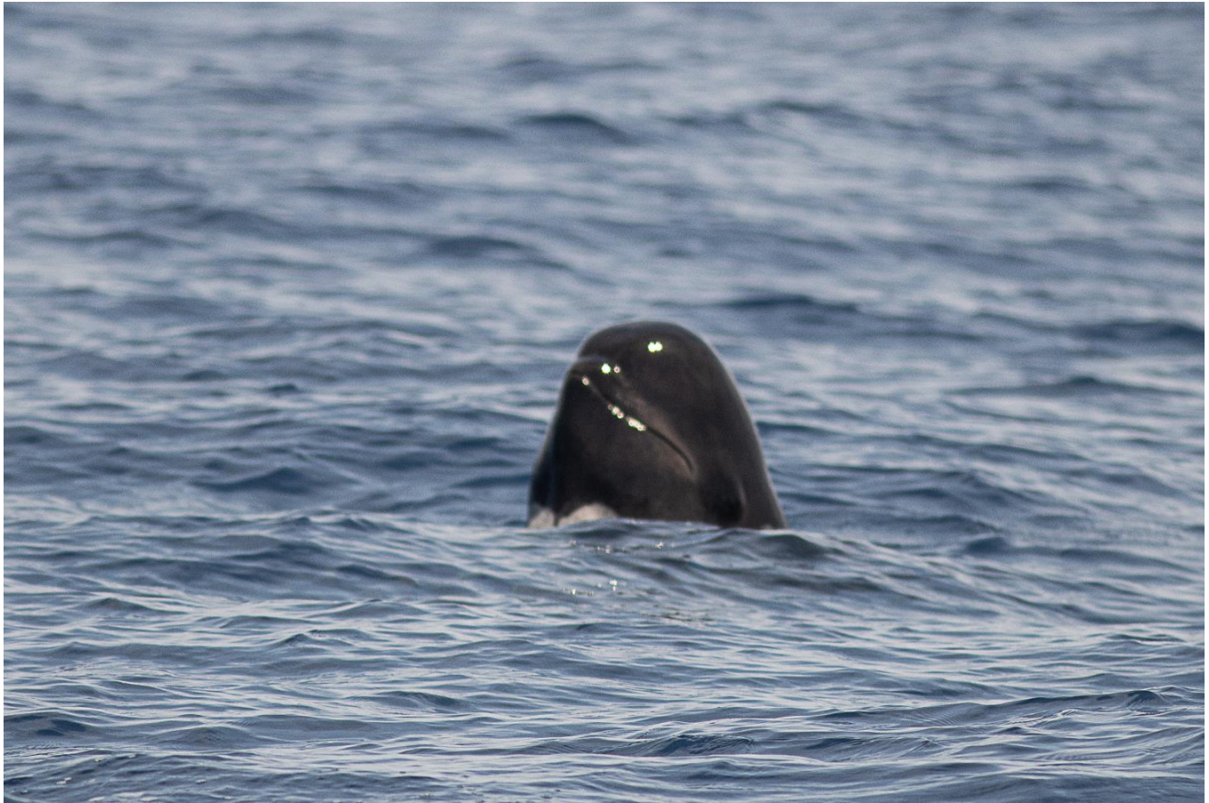
Globicéphale noir – Globicephala melas

Repas préparés en communauté et pris à bord.