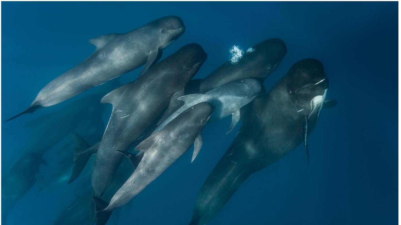
Globicéphales noirs – Globicephala melas

Cétacés difficiles à observer mais probablement présents dans la zone : Cachalot nain ( Kogia sima ), le Mésoplodon de Blainville ( Mesoplodon densirostris ) et le Mésoplodon de Sowerby ( Mesoplodon bidens ).