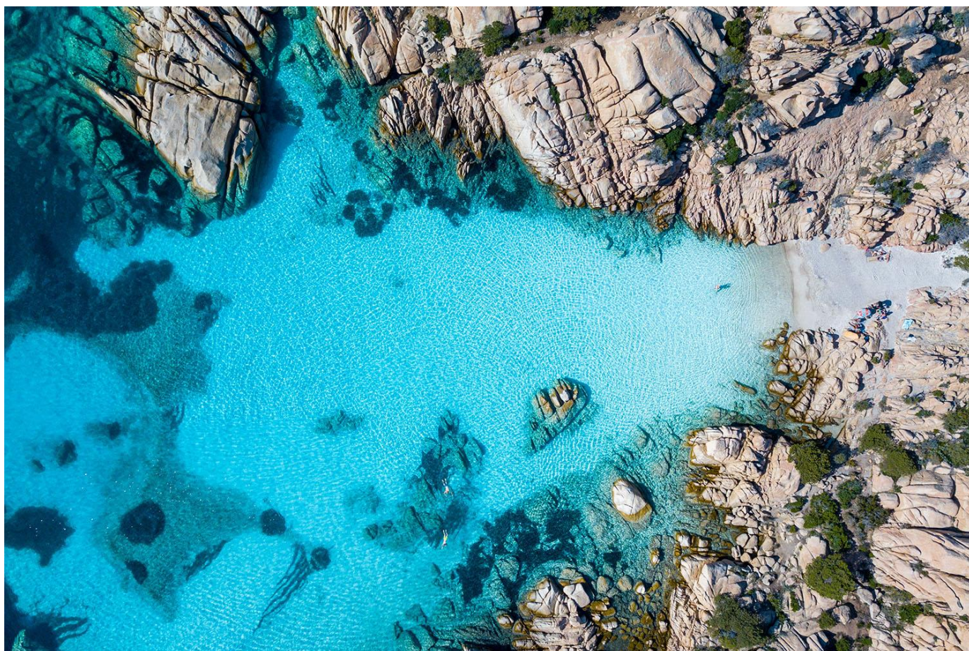
Archipel des Maddalena - Sardaigne

Repas préparés en communauté et pris à bord.