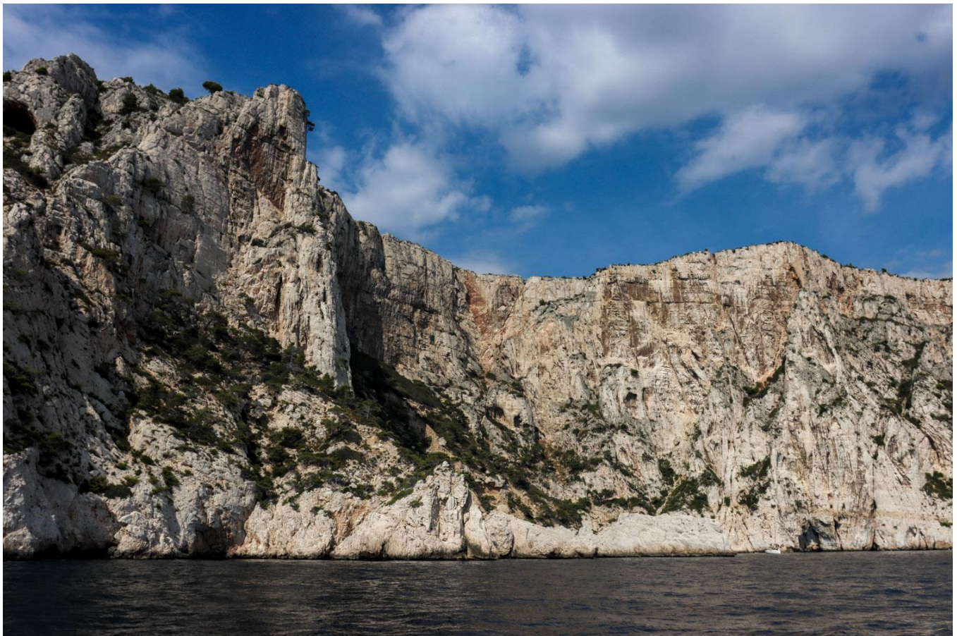
Parc National des Calanques de Marseille

Repas préparés en communauté et pris à bord.