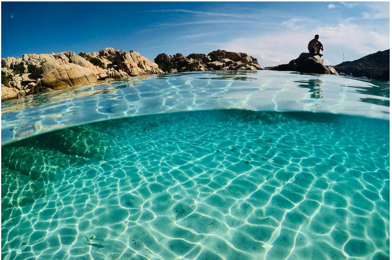
Côte Nord de la Sardaigne

Repas préparés en communauté et pris à bord.