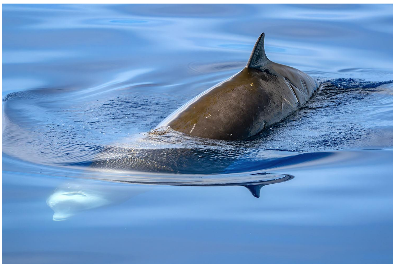
Baleine à bec – Ziphius cavirostris

Repas préparés en communauté et pris à bord.