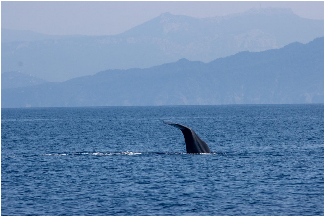
Grand cachalot – Physeter macrocephalus

Avec autant d'heures passées en mer que la météo le permettra , vous augmentez vos chances, déjà élevées, d'observer des cétacés.