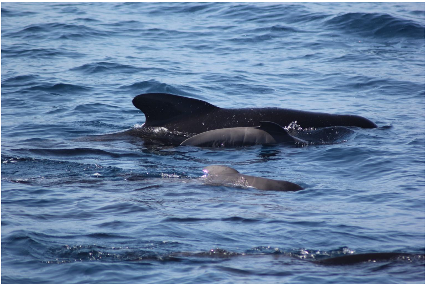
Femelle globicéphale et deux nouveau-nés (on observe les plis fœtaux sur leur corps

Lors des sorties en mer, selon les conditions météorologiques, il sera possible d'écouter ces cétacés par l'immersion d'un hydrophone , d'observer le microplancton , base de la chaîne alimentaire et monde étrange d'animaux microscopique. L'observation du plancton montre également, et malheureusement systématiquement, la pollution en microplastiques . Vous contribuerez à une récolte à l'aide d'un filet Manta ; les échantillons sont dosés par un laboratoire partenaire, OceanEyes, qui porte un plaidoyer international contre cette pollution. De quoi voyager utile !