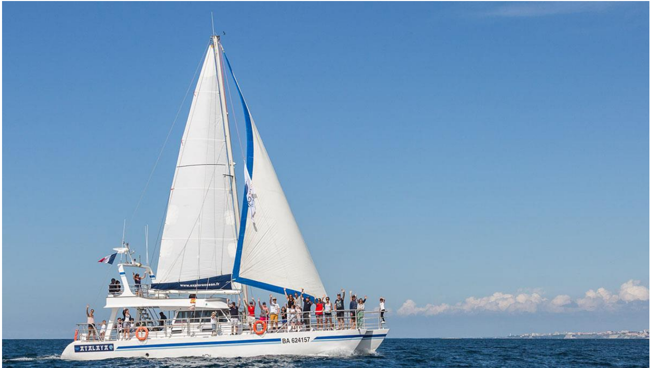
Catamaran (Antalaya) d'embarcation pour les sorties d'observation et d'étude des cétacés