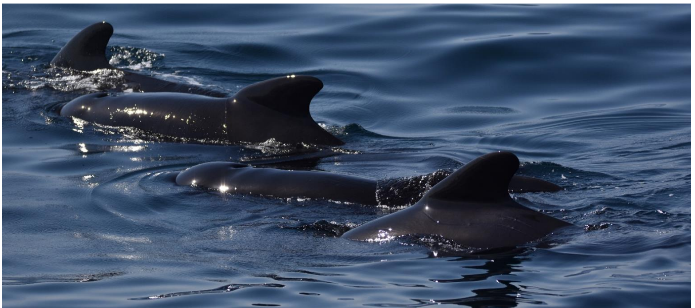
globicéphales noires nageant à proximité du bateau

Nuit au sein d'un gîte pour groupe. Petit-déjeuner et dîner inclus au gîte. Déjeuner pris sur le pouce sur le bateau.