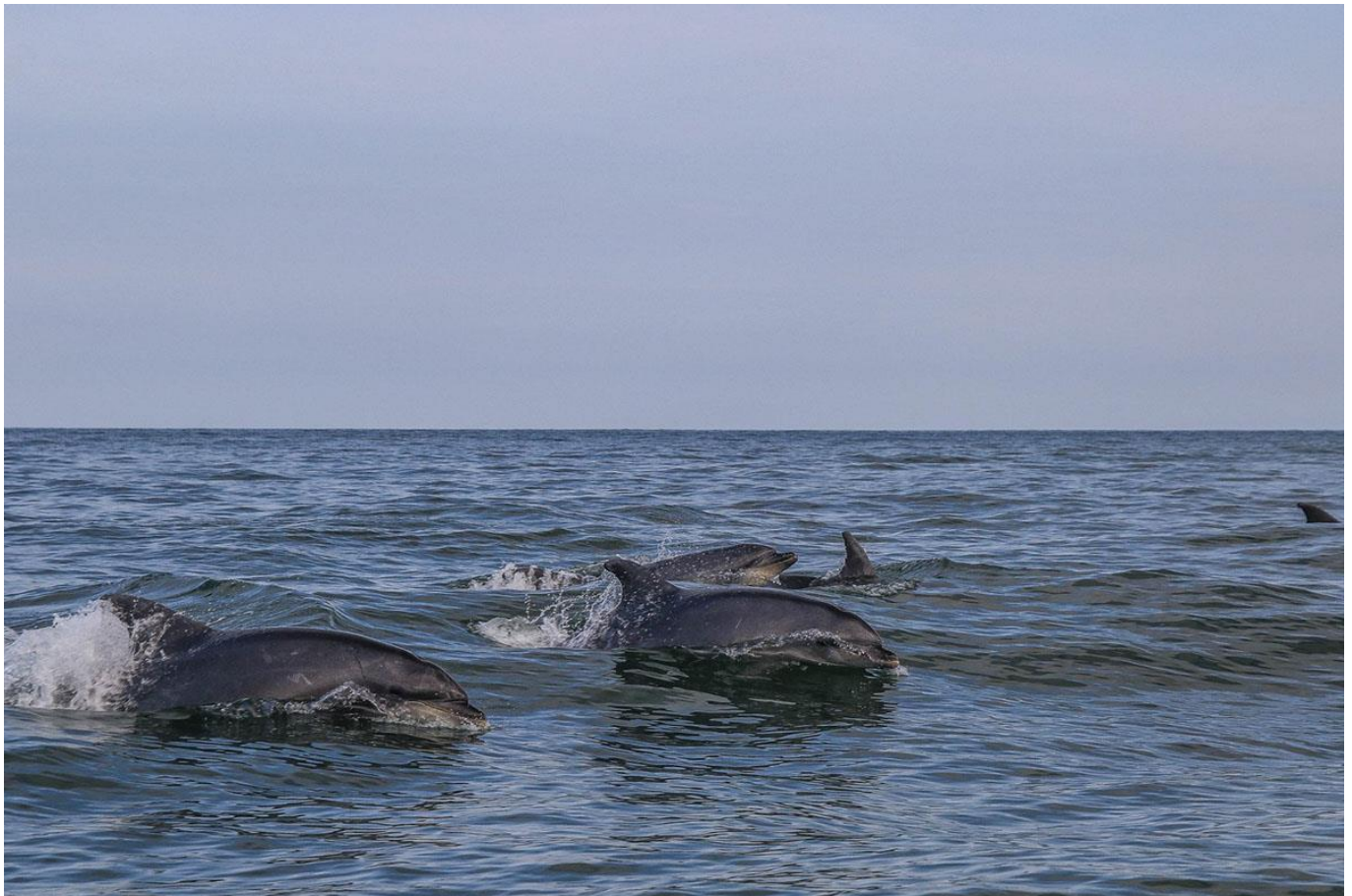
Groupe de grand dauphin ( Tursiops truncatus )

NB : Cet itinéraire est donné à titre indicatif : selon les conditions météorologiques, les contraintes opérationnelles ou un événement d'intérêt ponctuel, votre guide pourra le modifier pour votre sécurité et le bon déroulement du séjour.