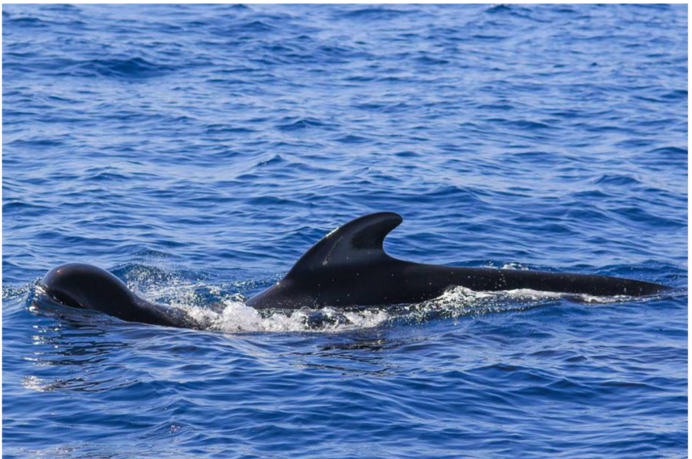
Globicephales noirs ( Globicephala melas )

Nuit au sein d'un gîte pour groupe. Petit-déjeuner et dîner inclus au gîte. Déjeuner pris sur le pouce sur le bateau.