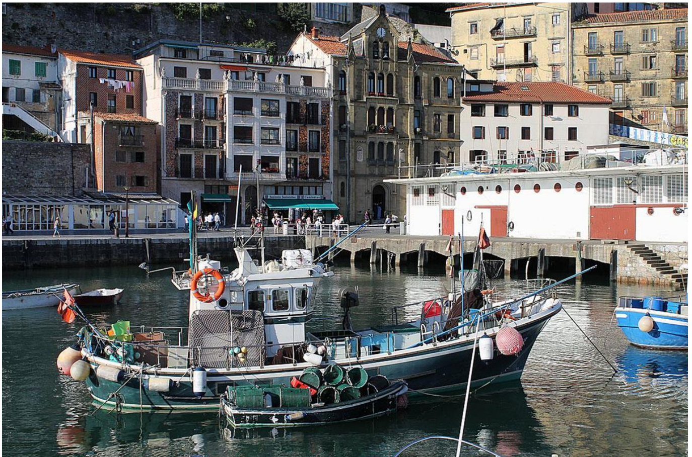
Saint Jean de Luz

Nuit au sein d'un gîte pour groupe. Petit-déjeuner et dîner inclus au gîte. Dîner dans un restaurant luzien.