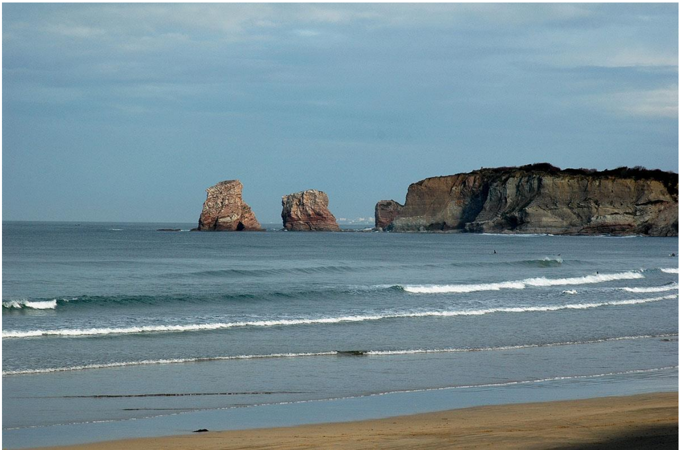
Les deux jumeaux, Hendaye

Votre première nuit, et les suivantes au sein d'un gîte pour groupe. Dîner inclus au gîte.