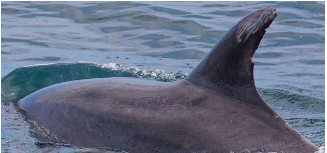
Photo identification de la dorsale d'un grand dauphin ( Tursiops truncatus )

A l'ordre du jour : observation comportementale, photo-identification, mesures sous-marines, enregistrement des vocalises.