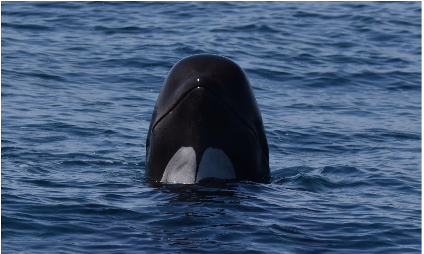
Position de l'espion ou spyhopping d'un globicéphale

Les mammifères marins nous fascinent par un comportement auquel nous prêtons des interprétations humaines. Les médias invitent les curieux vers des destinations lointaines, à la rencontre de ces animaux. La richesse des eaux françaises n'est pas souvent mise en avant et pourtant, le globicéphale noir qui fait tant parler de lui au Féroé, se reproduit au large du Pays basque, à quelques heures de bateau. Comme tous les mammifères, tous les groupes se rassemblent au printemps pour la reproduction et la mise bas des nouveau-nés. Malgré cette proximité, cette espèce reste mal connue et ne fait l'objet d'aucune étude.