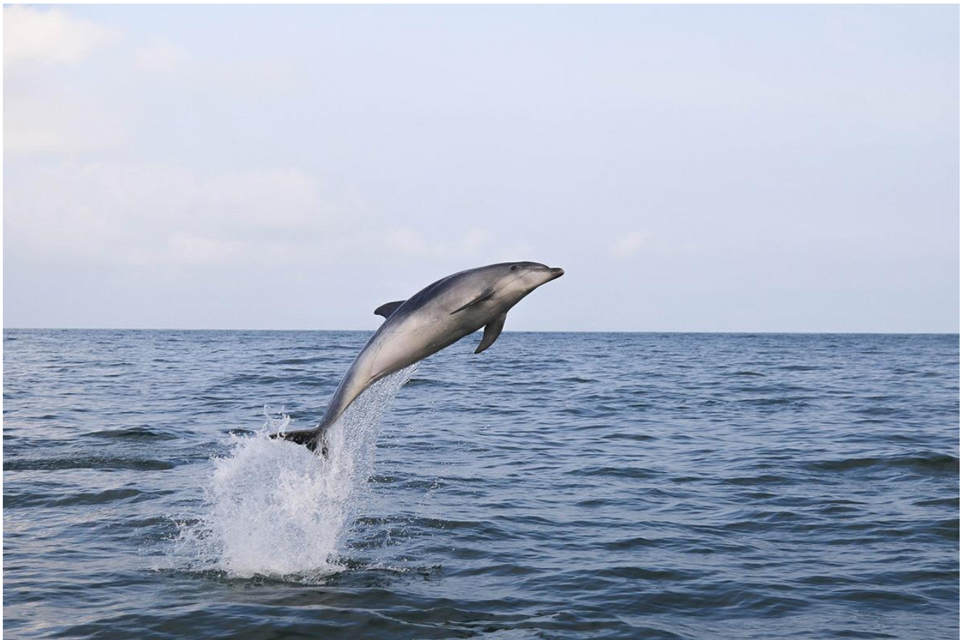
Saut d'un grand dauphin (tursiops truncatus)

Nuit au sein d'un gîte pour groupe. Petit-déjeuner et dîner inclus au gîte. Déjeuner pris sur le pouce sur le bateau.