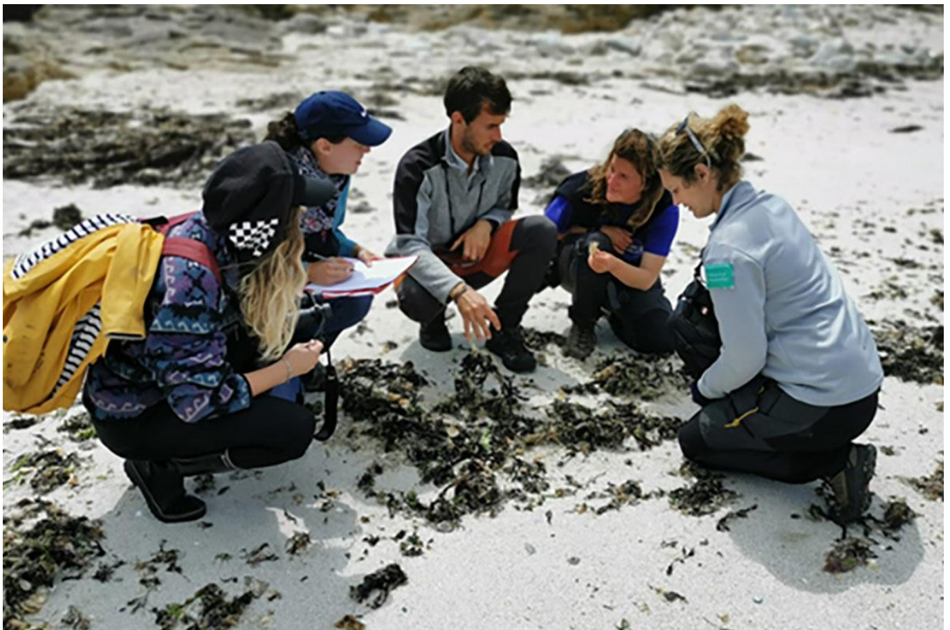
Collecte de données sur la laisse de mer

Nuit au sein d'un gîte pour groupe. Petit-déjeuner et dîner inclus au gîte. Déjeuner pris sur le pouce lors de la randonnée.