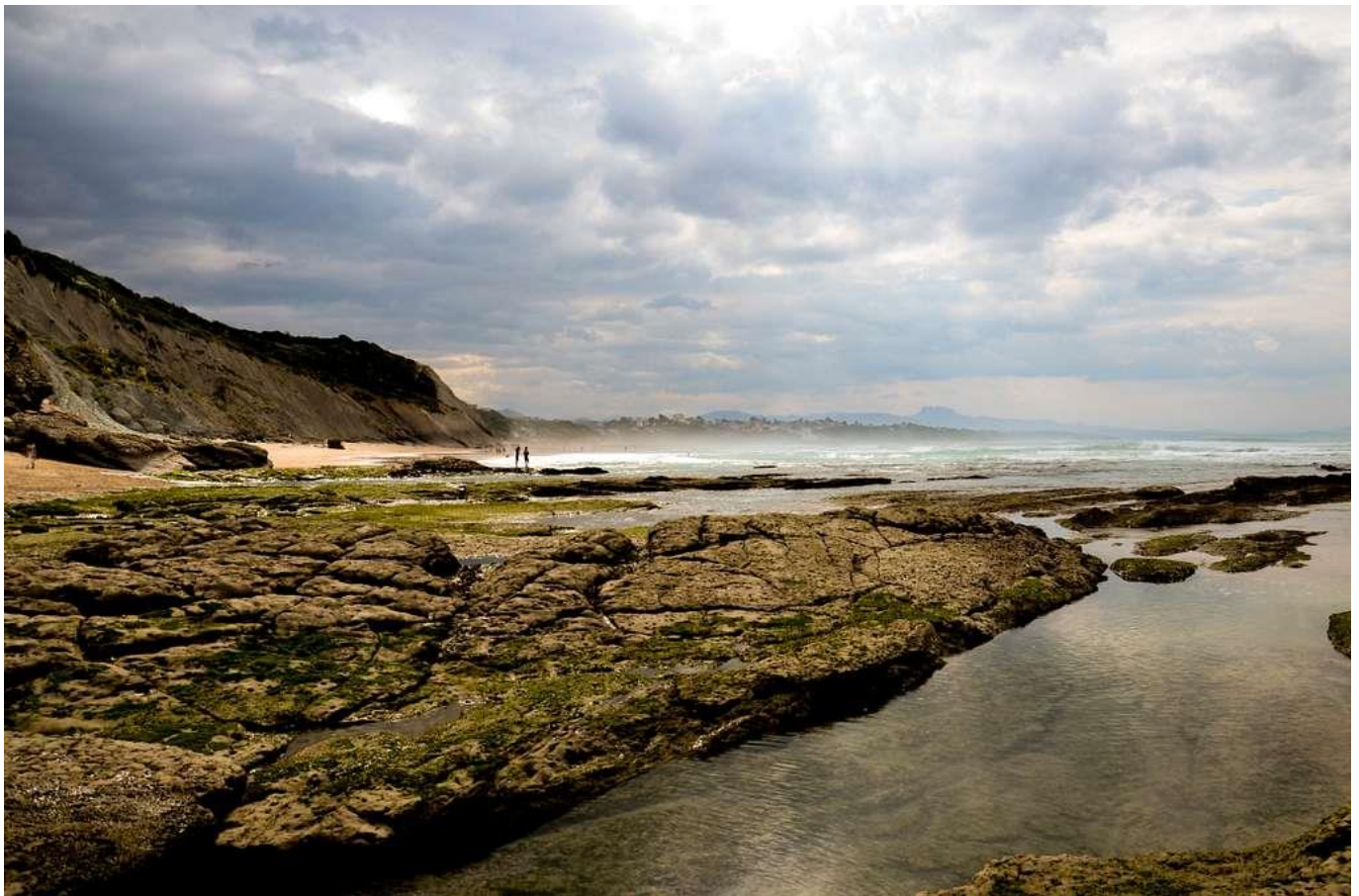
Sentier des baleines, Bidart

L'après-midi, des activités vous seront proposées pour en apprendre plus sur les mammifères marins et préparer votre première sortie en mer du lendemain.