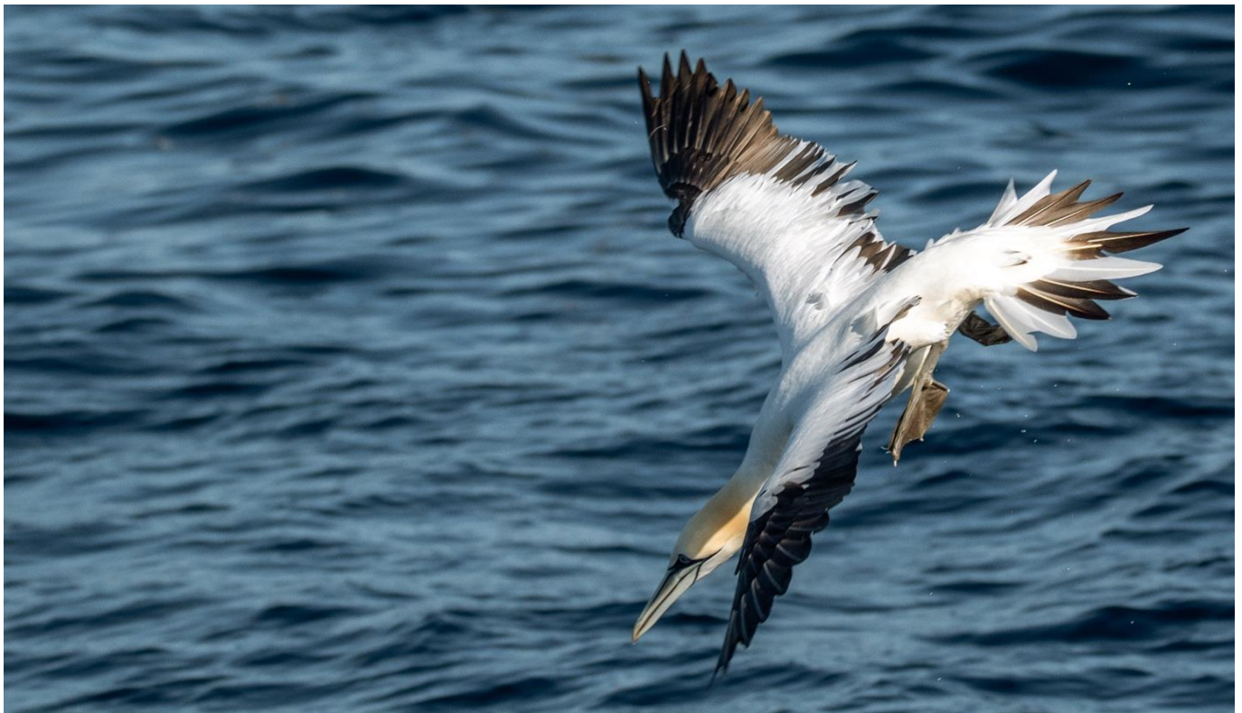
Plongeon en chute libre d'un Fou de bassan

IMPORTANT : En cas d'indisponibilité imprévisible de l'un de nos accompagnants, nous nous réservons le droit de le remplacer par une personne de qualité ou de compétence similaire, sans que son absence puisse constituer un motif significatif d'annulation de la part d'un voyageur.