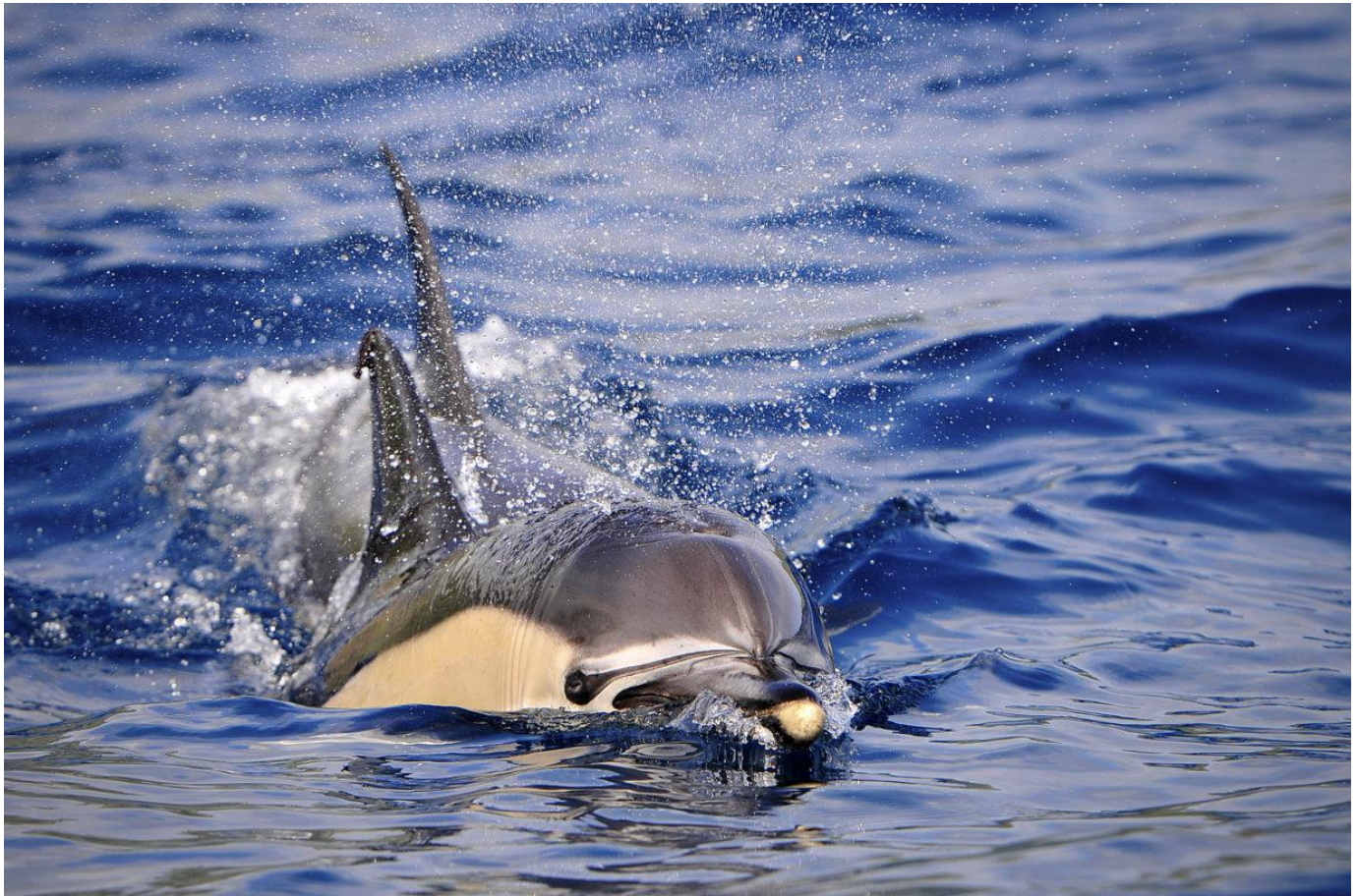
Couple de dauphins communs photographié de face

Vous y êtes, votre dernière journée en mer . Vos batteries sont chargées, vous avez vos cartes mémoires, les conseils bien ancrés dans la tête ! C'est LA dernière occasion , celle à ne pas manquer ! Tous les yeux sont en recherche d'un signe de présence animale ! Sur votre destrier, vous êtes parfaitement à l'aise dans la prise de vue, dans la recherche active des animaux ! Certains espèrent une nouvelle espèce, celle qu'on n'a pas encore vu, d'autres souhaitent revoir leur favorite ! Tout le monde rêve, certains vœux seront exaucés ! Vous vous surprenez à essayer de reconnaître certains individus grâce aux marques présentes sur les nageoires ! Vous donnez un nom, vous photo-identifiez, comme pour marquer à jamais ce souvenir fabuleux d'un géant des mers , dans les eaux d'un archipel fabuleux