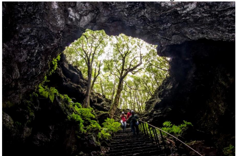
Grotte de Torès, entrée du tube de lave

L'après-midi vous demandera de troquer téléobjectif contre trépied , d'augmenter ISO et/ou temps de pose, pour photographier l'intérieur de la terre ! Echangez votre crème solaire (bio) contre un casque et une lampe torche ! Bienvenue dans le tube de lave de la grotte de Torès, l'un des plus longs tubes de lave du monde ! Une balade sur les falaises basaltiques de Candelaria vous permettra de photographier un autre visage des paysages volcaniques des Açores.