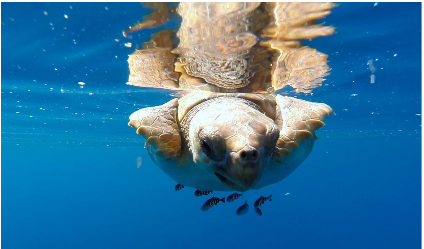
Tortue marine photographiée sous l'eau

Il serait bien dommage de ne pas visiter Sao Jorge , l'île voisine à Pico, tant elle est proche et elle aussi remarquable ! Rendez-vous matinal pour cette excursion d'une journée sur la biodiversité des Açores, dont un remarquable aperçu sera donné par la mer ! Votre journée commence par du bird-watching dans la zone humide de Lajes depuis la terre, puis depuis la mer. Une fois en mer les dauphins et baleines seront dans votre « ligne de mire », au sud de Pico. Un pique-nique, puis une baignade dans le port isolé de Calheta (Sao Jorge) vous donnera l'occasion d'observer balistes et autres poissons perroquets . Le reste de la journée sera entrecoupé de mer, de falaises, et peut-être même de tortues marines et de requins prêt de l'îlot de Topo, propice aux observations !!! Vous terminerez votre journée par l'observation d' oiseaux sur la côte basaltique de Manhenga et Rocha Vermelha .