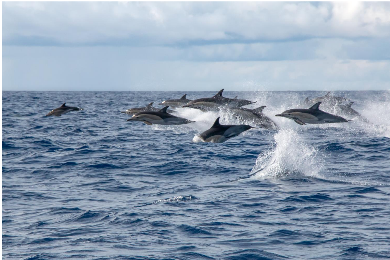
Groupe de Dauphins communs fuyant probablement un prédateur

Après cette dernière nuit sur l'Archipel de tous les rêves, vous rejoignez l'aéroport de Pico ou de Faial pour prendre votre vol, direction Paris.