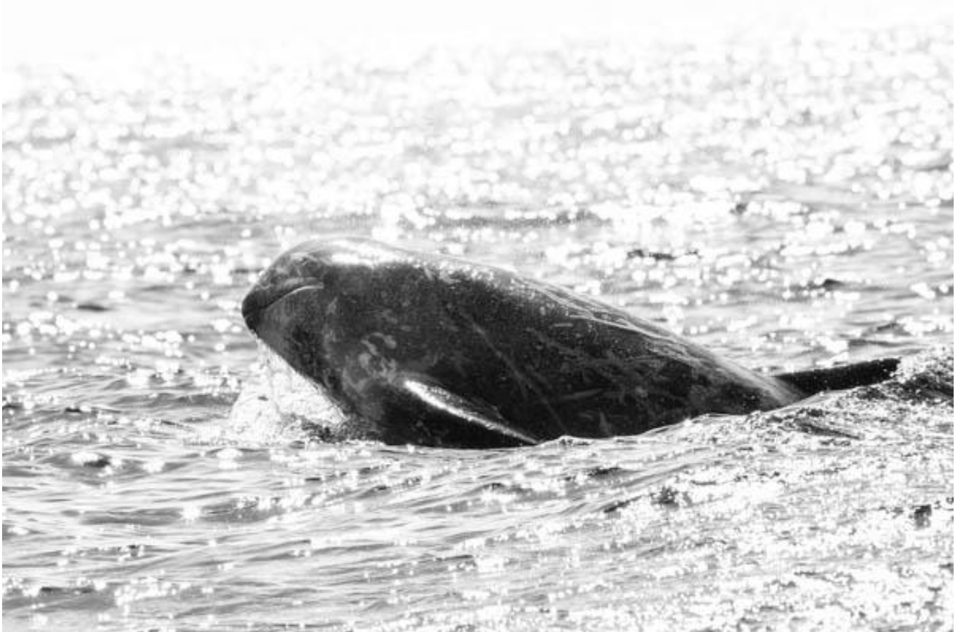
Saut d'un Dauphin de Risso ( Grampus griseus )

8 journées à sillonner les eaux du légendaire archipel des Açores, entre Pico, Faial et Sao Jorge, pour rencontrer la majestueuse faune marine de l'Atlantique, oiseaux marins, cétacés et autres animaux emblématiques ! Ce séjour photo est composé d' itinéraires photographiques et les sorties privatisées sont spécialement conçues pour les photographes. A terre mais surtout en mer à bord d'un bateau, au large des côtes des Açores, vous recherchez à croiser le regard de l'un de ces grands prédateurs et l'immortaliser. Votre objectif sera de rentrer avec LE cliché espéré, LA photo animalière tant voulue, mais pas à n'importe quel prix ! Toutes vos observations seront accompagnées d'une approche éthique et naturalistes ! C'est en connaissant son sujet qu'on le photographie le mieux ! Les occasions photographiques seront nombreuses : lumières