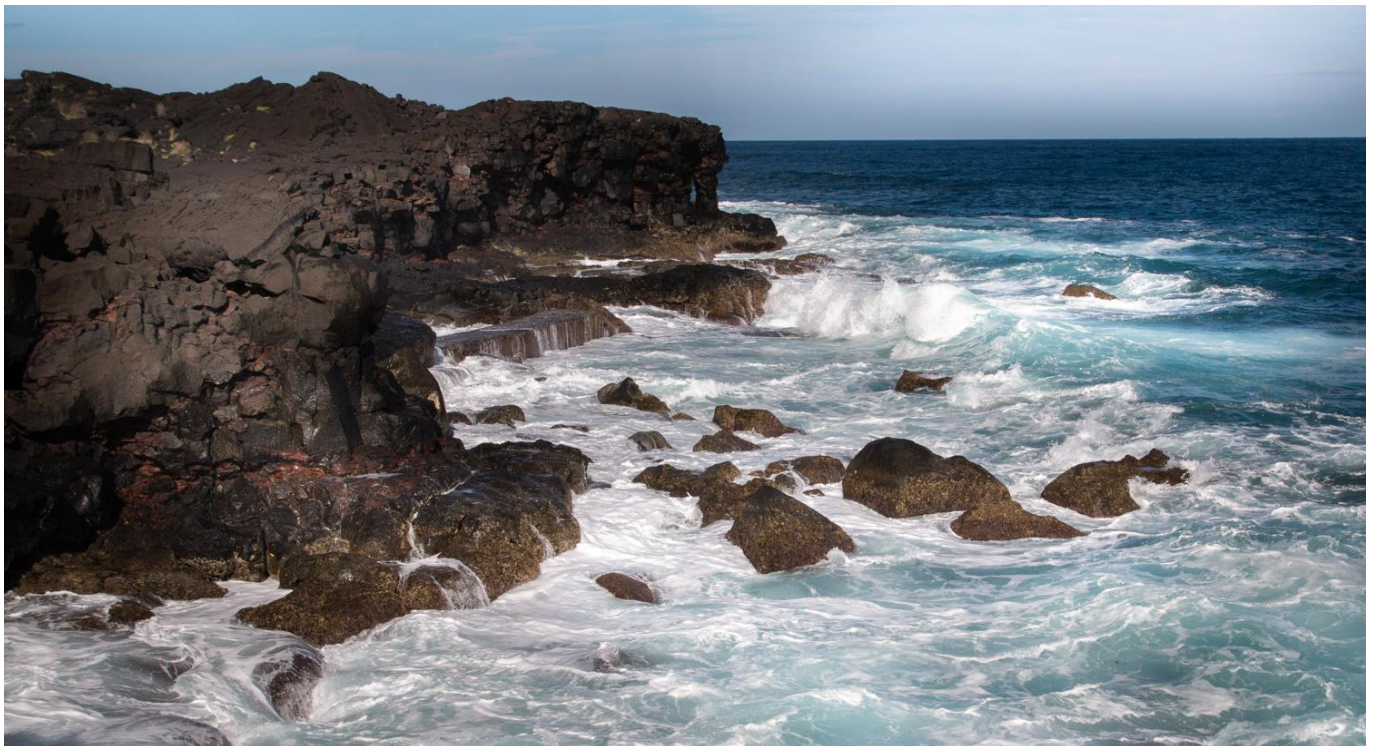
Côte basaltique de l'île de Pico

IMPORTANT : En cas d'indisponibilité imprévisible de l'un de nos accompagnants, nous nous réservons le droit de le remplacer par une personne de qualité ou de compétence similaire, sans que son absence puisse constituer un motif significatif d'annulation de la part d'un voyageur.