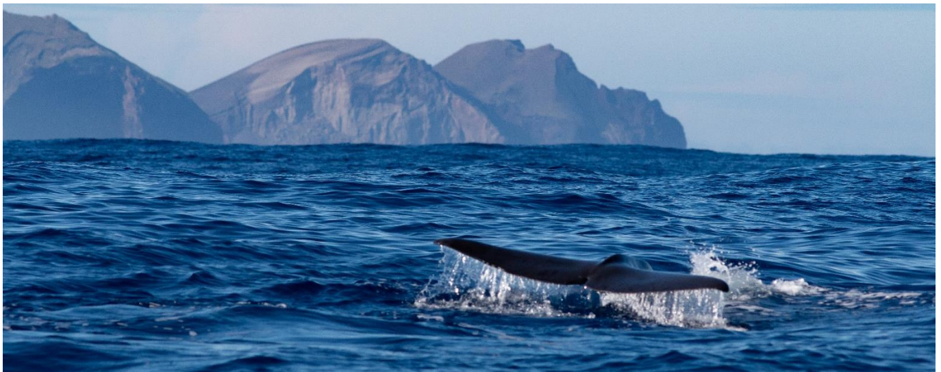
Sonde d'un Grand Cachalot devant l'île de Pico

L'archipel des Açores est l'une des 10 meilleures destinations pour l'observation des cétacés. 27 espèces de cétacés y ont été répertoriées dont le Cachalot, l'Orque, la Baleine Bleue, la Baleine à Bosses et d'innombrables espèces de dauphins ! La faune marine est riche en surprises , et peut vous offrir de belles rencontres avec oiseaux marins, raies, requins et tortues. Si vous souhaitez remplir votre carte mémoire de souvenirs magiques, de rencontres inespérées, de rêves éveillés , c'est sur ce petit archipel portugais perdu entre l'Europe et l'Amérique qu'il faut se rendre !