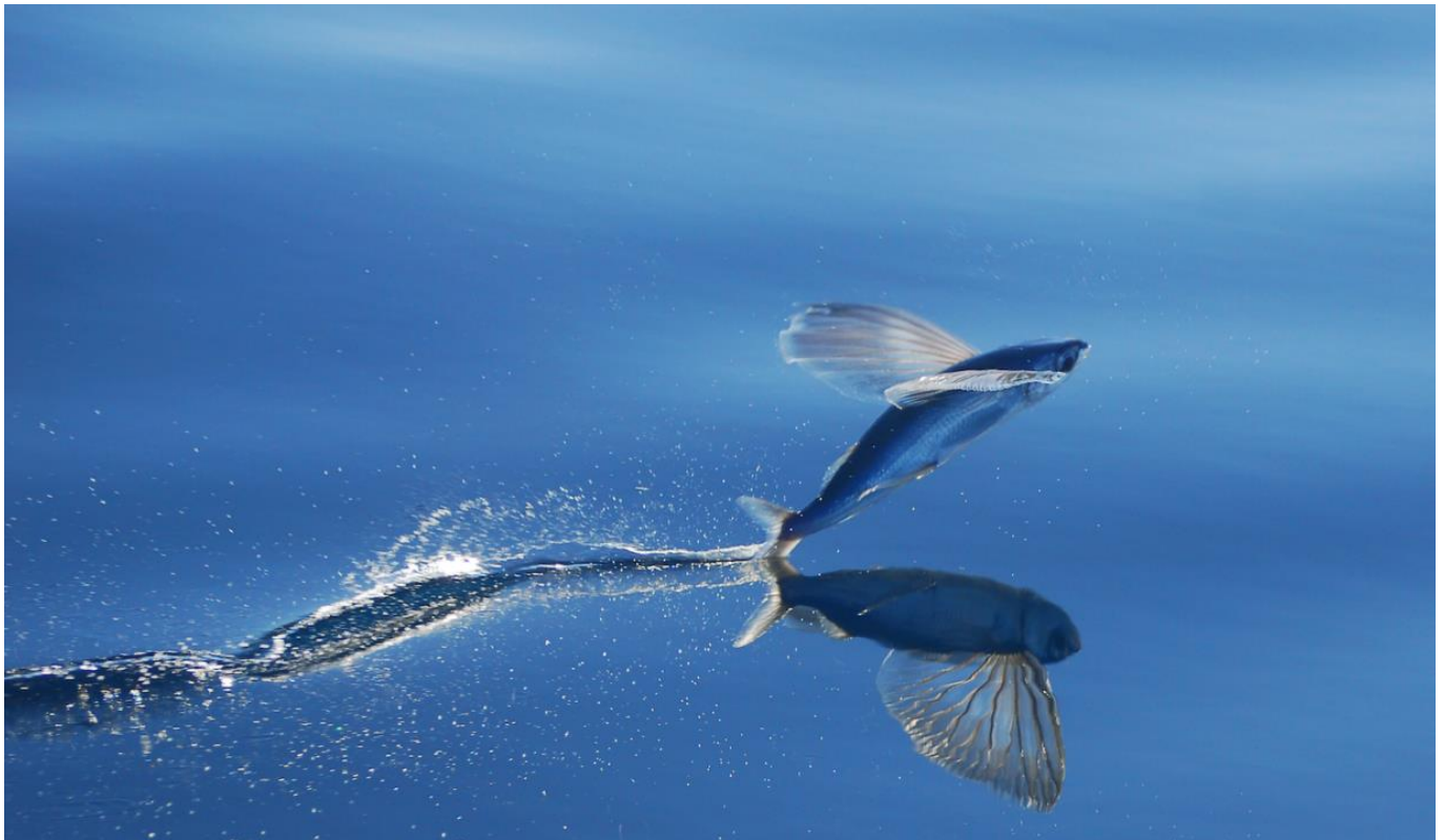
Poisson volant

Vous aimez les extrêmes ? Cette journée est faite pour vous ! Rendez-vous sur les eaux le matin pour immortaliser l'ambiance marine, les puffins en vol, pourquoi pas des tortues aujourd'hui ? Peut-être même réussirez-vous l'exploit de photographier un poisson volant !