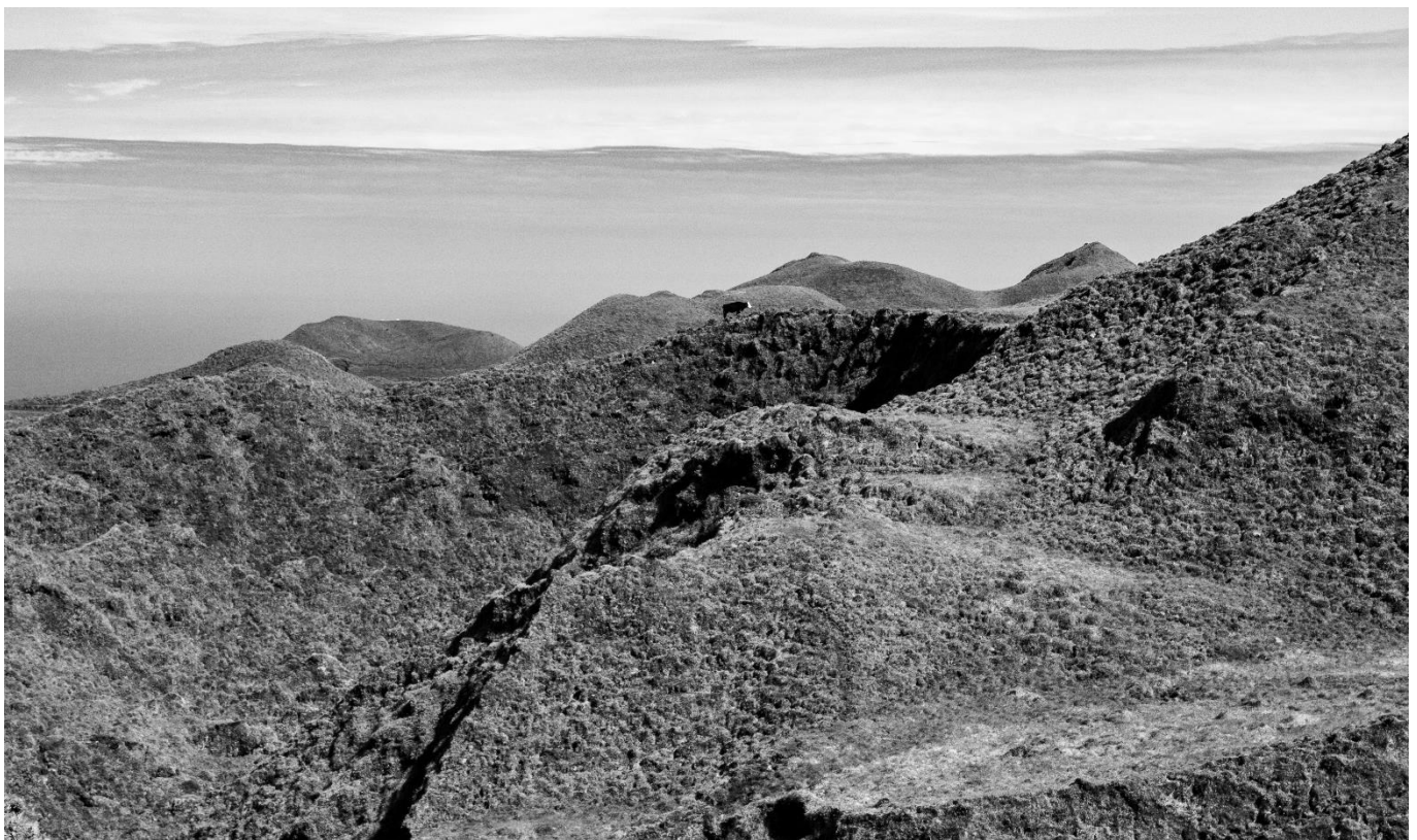
Dauphin commun et Puffin cendré - Les vaches de Pico

Qui dit Açores, dit Cétacés, certes ! Mais qui dit Açores dit aussi Volcans, lacs et forêts endémiques !