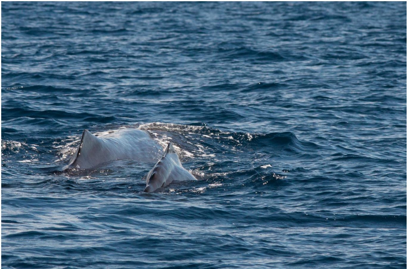
Crête dorsale d'un Cachalot adulte et d'un juvénile qui sondent

Après un bon repas, un débriefing photo vous est proposé afin de comprendre où sont vos erreurs (s'il y en a) et comment vous pourriez encore améliorer votre photo, en termes de technique ou en termes de composition !