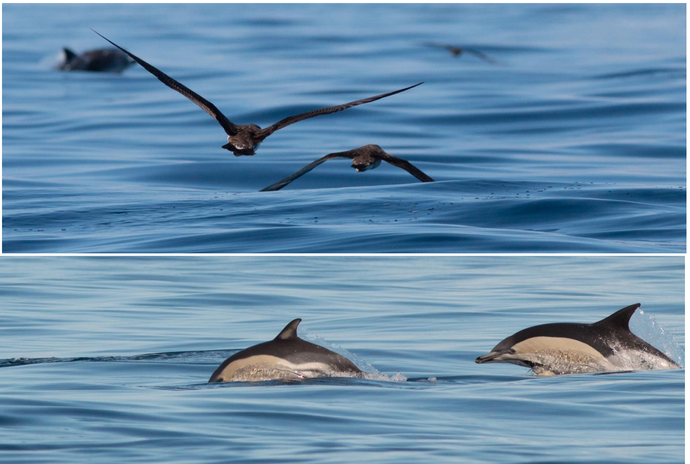
Dauphins communs évoluant dans une mer presque d'huile

Une nouvelle journée en mer, c'est une nouvelle occasion d'obtenir LE cliché ! Vous êtes devenu un AS pour appréhender le comportement des cétacés et donc pour savoir quand déclencher ! Vous connaissez les réglages nécessaires en mer, le bateau se place pour que vous obteniez les plus belles lumières ! A vous de jouer, vous n'avez plus qu'à choisir : photo minimaliste d'une caudale qui sonde au milieu de nulle part ou d'un dauphin qui saute au loin, un événement en gros plan, l'arc en ciel provoqué par un souffle... ! Votre photo n'a de limite que votre imagination et la présence des animaux ! Mais vous êtes aux Açores, vous ne prenez pas beaucoup de risques !