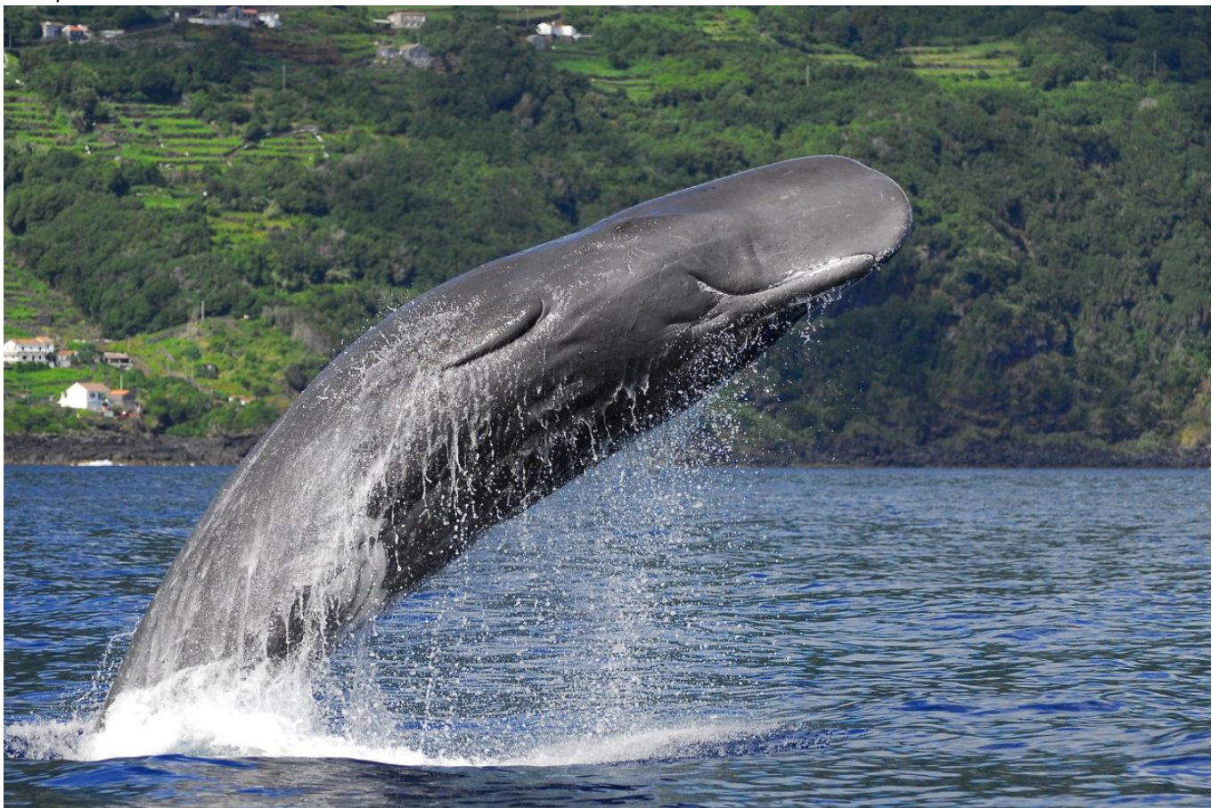
Saut d'un Grand Cachalot dans les eaux de l'Archipel des Açores

Cétacés à fanons déjà observés aux Açores : Rorqual commun, Petit rorqual, Rorqual de Bryde, Rorqual boréal, Baleine bleue, Baleine à bosse, Baleine franche.