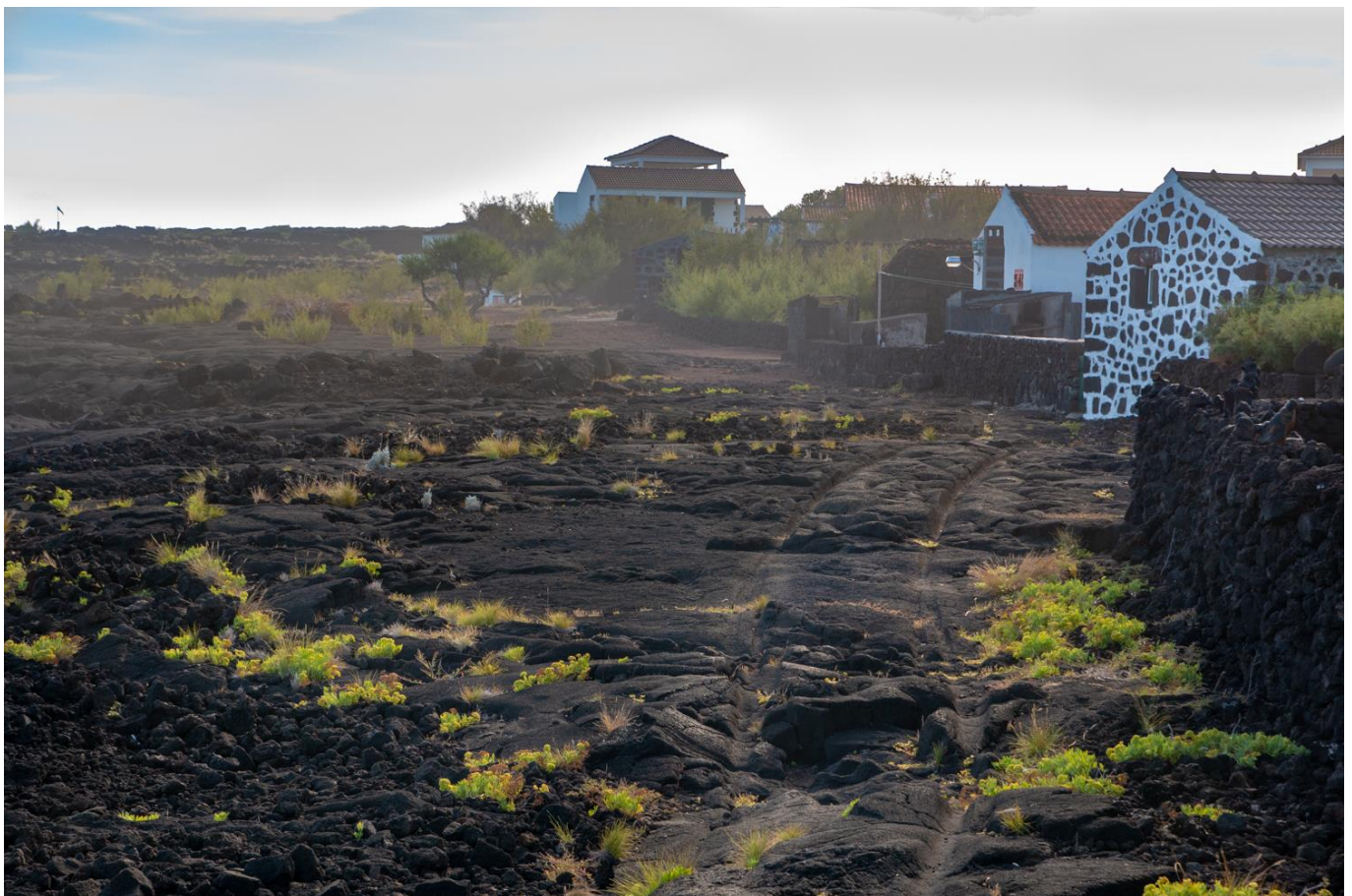
Village sur une côte basaltique de l'île de Pico

A l'arrivée à l'aéroport de Pico ou de Faial, vous êtes transférés vers votre hôtel rural à Lajes do Pico. Après briefing sur le programme de votre voyage, vous êtes accueilli par un pot de bienvenue. Vous commencerez ensuite votre séjour en vous imprégnant des saveurs locales en prenant votre dîner au restaurant.