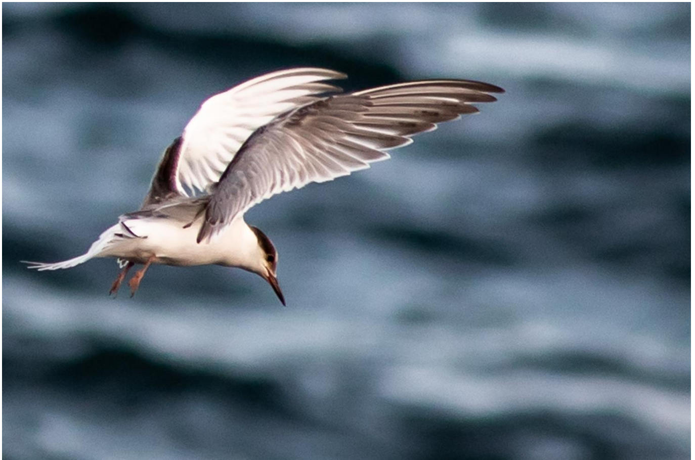
Sterne en vol

Pour le 3 e jour de votre séjour, vous testez un autre type de photographie, d'autres conditions. Si vous êtes habitués au téléobjectif et aux oiseaux , la matinée est faite pour vous ! C'est l'heure du bird-watching . Votre spot d'observation ? La Faja laviague de Lajes de Pico (geopark) où nidifient chaque année une importante colonie de Sterne Pierregarin mais aussi la Sterne Dougall. Vous pourrez peut-être y observer également pluviers, hérons, aigrettes, et chevaliers ! Une excursion dans la réserve naturelle du Caveiro vous donnera peut-être l'opportunité d'observer le Serin, le Pinson et le Roitelet huppé mais aussi des espèces de canards Américains près des lacs !