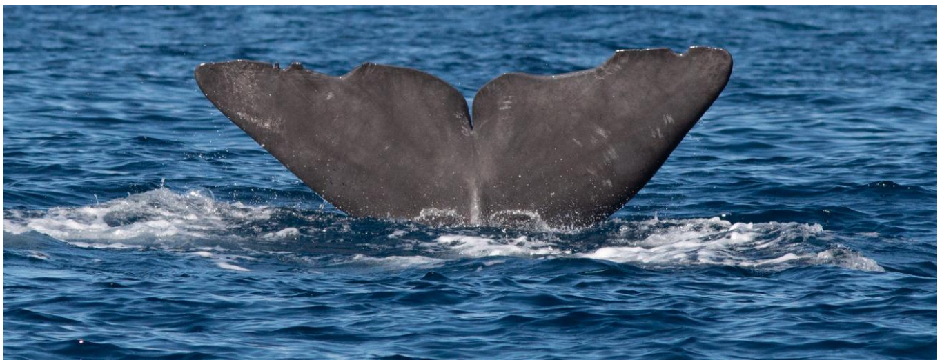
Caudale de Grand Cachalot photo-identifié avant sa sonde

Un catalogue de photo-identification est maintenu en place aux Açores, afin de pouvoir identifier individuellement les animaux présents ou de passage sur la zone. C'est l'occasion pour chaque voyageur de voir les choses autrement et de comprendre que la photo c'est de l'art, mais que cet art peut contribuer à la conservation et à l'étude des animaux !